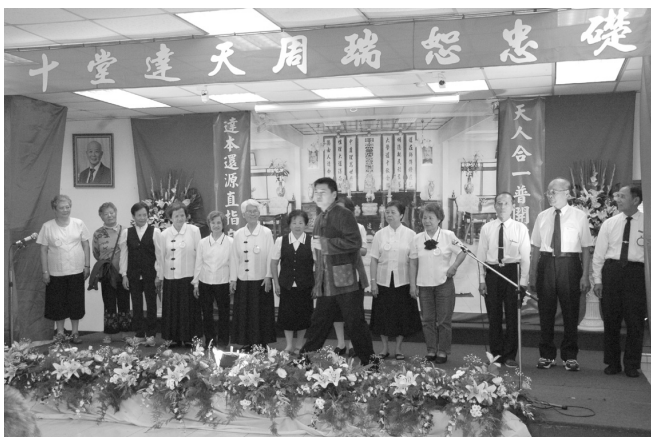
△活動中期許大家要好好修道。

舞者」，展現最優雅的東洋舞姿，呈現令人驚艷的古典之美；中生代道親十足童趣的嬰兒裝扮，表演手語與朗誦，不僅充分展現感恩的情懷，更博得滿堂老菩薩的歡顏一笑；天真無邪的小朋友排演兒童劇—「貪吃的小狐狸」，可愛簡單的小故事中，充滿童趣與寓意；活力無限的青年班，載歌載舞，再搭配趣味戲劇表演，讓人欣慰於道場傳承的光明前景。其他如金門道親素樸的「阮是金門人」，精采的「太極劍舞」，展現兒童赤子心的詩經唱誦……，等演出，莫不精采用心，讓所有與會來賓同沾法喜。